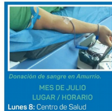
Donación de sangre en Amurrio. MES DE JULIO LUGAR / HORARIO Lunes 8: Centro de Salud